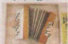
Ett annorlunda konstverk som museet fått till skänks.