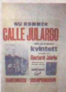
Originalaffisch med Calle Jularbo.