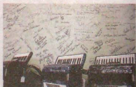
Autografväggen tillhör rariteterna hos Karlssons Musik med flera kända namnteckningar.